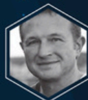
Propos introductifs MICHEL MOUTSCHEN Vice-recteur à la recherche de l'Université de Liège